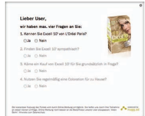
Abb. 2: Fragebogen zur Messung der Markenwirkung

von 20-49 Jahren, ausgeliefert. Die Reichweite innerhalb der vierwöchigen Kampagne betrug fünf Millionen Kontakte. Durch Kontaktklassenoptimierung , eine Kombination aus Frequency-Boosting und globalem Frequency-Capping, steuerte nugg.ad zudem die Häufigkeit der Werbeeinblendungen pro User.