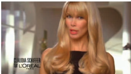
Abb. 1: PreRollAD für L'Oréal Excell 10'

Mit der nach neusten technischen Möglichkeiten umgesetzten Bewegtbildkampagne wurde außerdem ein Stück Online-Geschichte geschrieben: