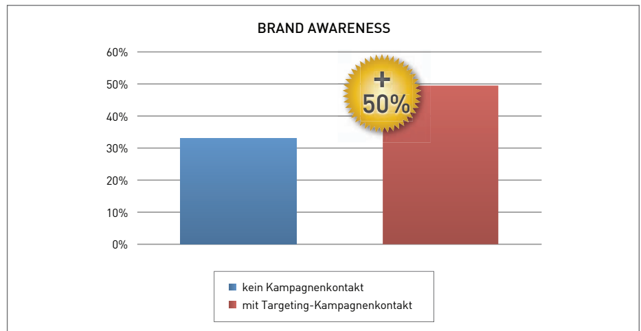
Abb. 3: Brand Engagement - Vergleich der Targeting Kampagne zur Kontrollgruppe

Die Brand Awareness wird bei zehn und mehr Kontakten optimal gesteigert. Für Brand Sympathie und Kaufbereitschaft wirkt sich ein Kontakt-Korridor von vier bis sechs Kontakten optimal aus.